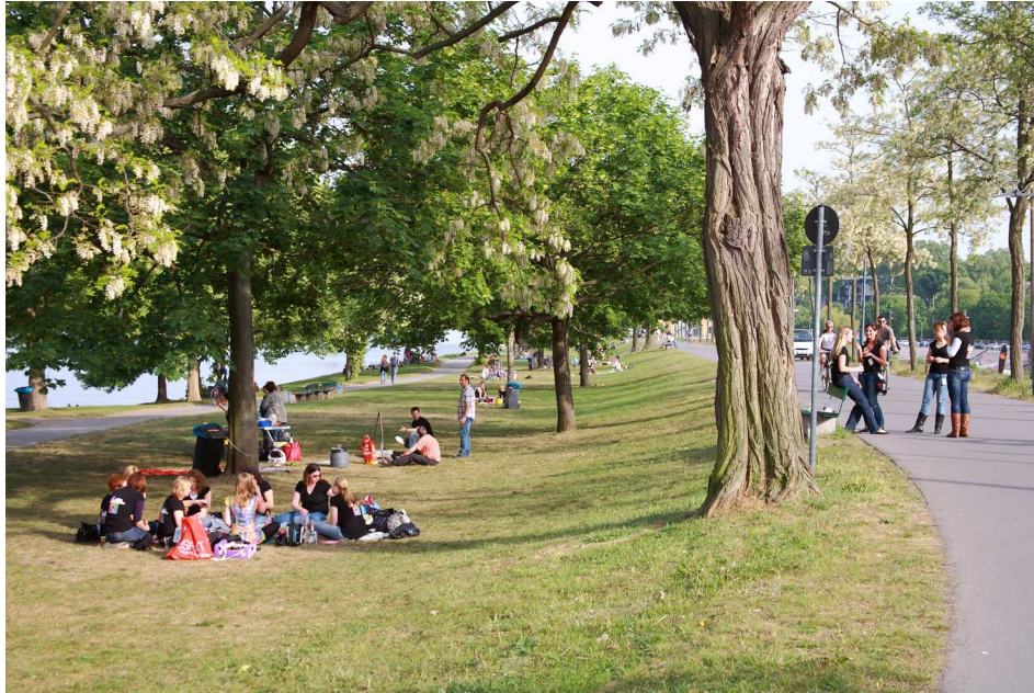
Das Rheinufer gefällt den Studierenden am Besten in Mainz.